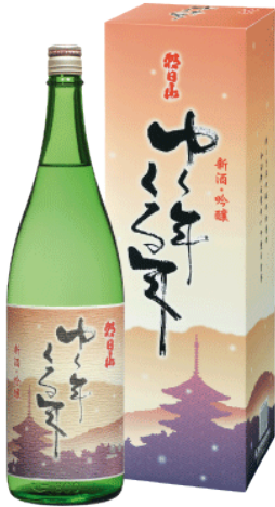
【1】朝日山 ゆく年くる年 吟醸

毎年恒例&人気！久保田を醸す、朝日酒造の新米新酒。新潟清酒ならではの淡麗辛口の本一です