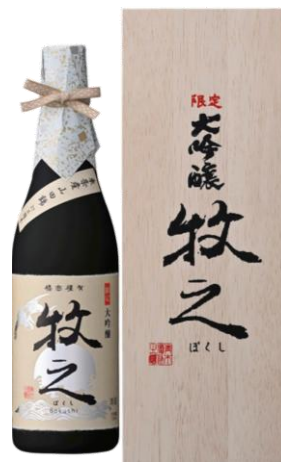
【3】牧之 大吟醸（鶴齢） 新酒鑑評会金賞酒

新潟・鶴齢を醸す、青木酒造の最高峰・全国新酒鑑評会金賞受賞酒。華やかな吟醸香、フルーティーな味わい