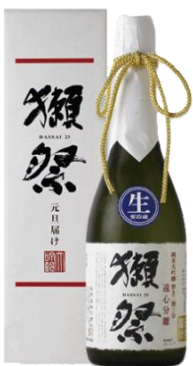
【5】獺祭 元旦届け 遠心分離 2割3分

【12月中旬 入荷予定】 新年のために用意された、特別な獺祭（おりがらみ）。綺麗な酒質と、おりの絶妙な膨らみ