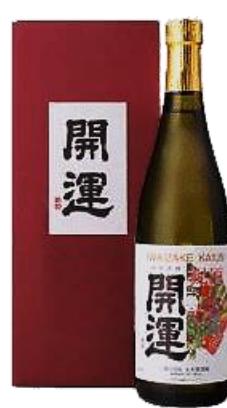
【7】開運 特選斗瓶取り 純米大吟醸

虎ノ門マスト限定の蔵出し！国内外のコンテストで受賞を重ねる静岡の蔵。華やかな香りと柔らかな甘みが特長の御祝酒