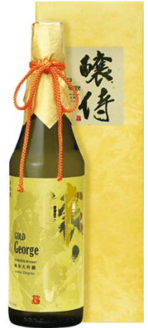
【4】醸侍 GOLD（奥の松） 純米大吟醸 雫酒

福島・奥の松酒造の特約店限定銘柄「醸侍」の最高峰・数量限定酒。上品な香りとすっきりとした口当たりが特長