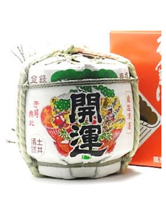
【8】開運 特別純米 豆樽入り

年末年始限定！開栓が簡単な蛇口式の小さい御祝樽。綺麗な米の味わいが楽しめます 新年の開運祈念にお勧めです