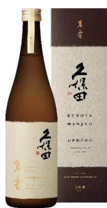
【6】久保田 萬寿 自社酵母仕込み

米・酵母・製法にこだわった特別な「久保田 萬寿」。通常の萬寿と比べ、更に香り高く、透き通るような味わいとキレ