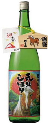
【2】朝日酒造 元旦しぼり 吟醸

【1月上旬 入荷予定】 元旦に搾り、ご祈禱をうけた絵馬付きのお祝い酒。瑞々しい口当たりと原酒ならではの力強さ